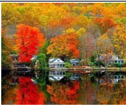
TRANH TRONG BT MÙA ĐÔNG