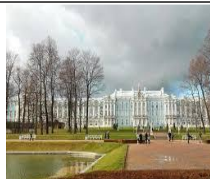
CUNG ĐIỆN EKATERINA