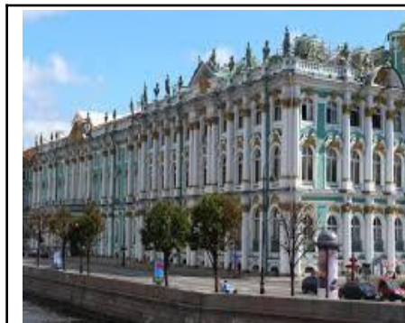
BẢO TÀNG MÙA ĐÔNG

Sau đó về khách sạn. Nghi đêm tại St. Petersburg.