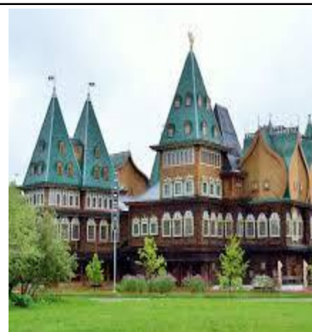
LÂU ĐÀI GỖ KOLOMENSKOE