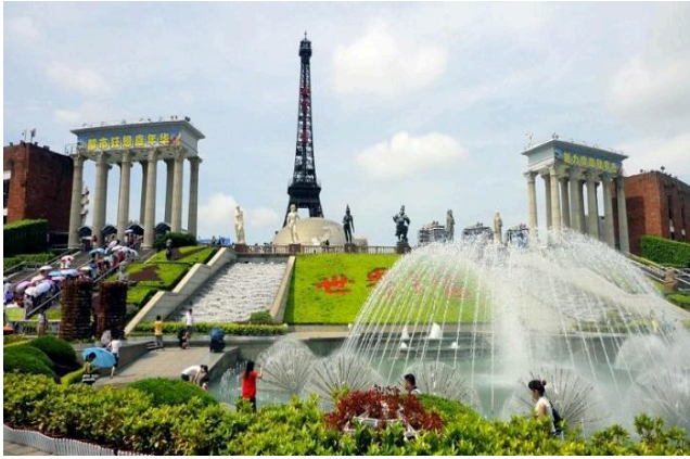
Công viên " Cửa sổ thế giới"