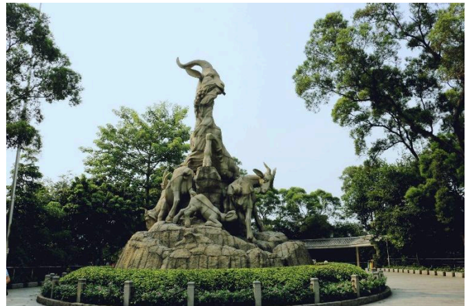
Công viên Việt Tú