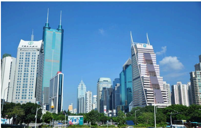
Tòa nhà Đế Vương