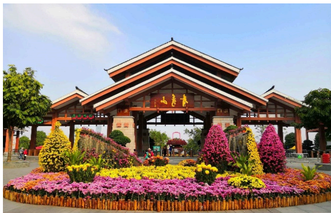
Công viên Thanh Tú Sơn