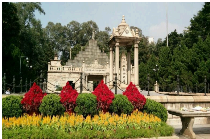
Công Viên Hoàng Hoa Cương

QUẢNG CHÂU - NAM NINH (ĂN SÁNG/ TRƯA/ TỐI)