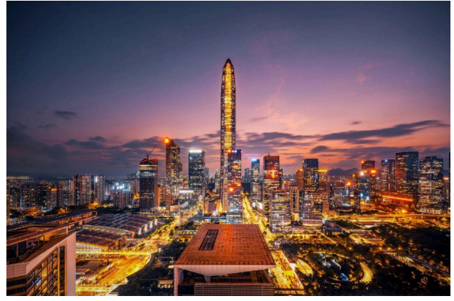
Thành phố Thẩm Quyến về đêm

Sáng: Quý khách dùng điểm tâm tại khách sạn sau đó Xe đưa quý khách đi thẳng đến Thâm Quyến - TP hiện đại vào bậc nhất Trung Quốc, tiếp giáp với đặc khu hành chính Hồng Kông. Quý khách thăm quan: