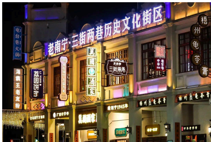
Phố đi bộ Bắc Kinh

Sau bữa sáng tại khách sạn, Đoàn tham quan: