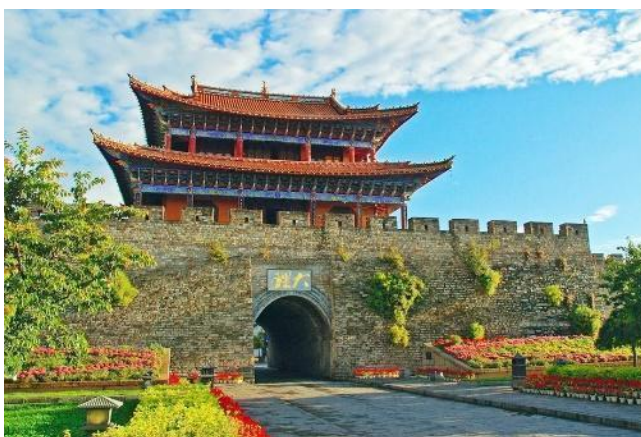
Thành cổ Đại Lý

Đoàn ăn sáng tại khách sạn. Sau bữa sáng, đoàn khách tham quan: