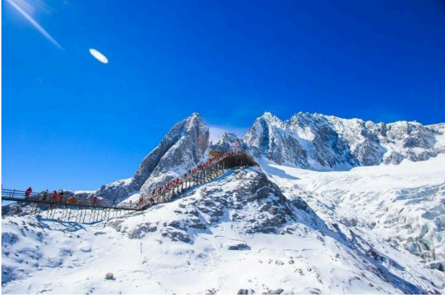
Núi tuyết Ngọc Long

LỆ GIANG - KHU NÚI TUYẾT NGỌC LONG (30KM) (ĂN SÁNG/ TRƯA/ TỐI)