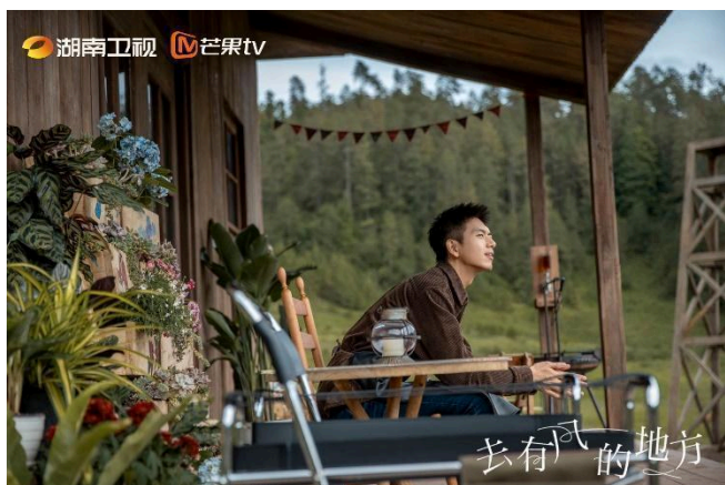
Phương Dương Ấp thôn