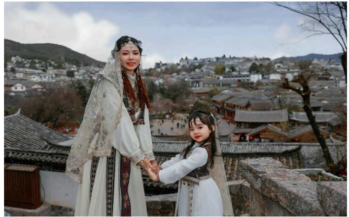
Thành cổ Lệ Giang

Đoàn ăn sáng tại khách sạn. Sau bữa sáng, đoàn làm thủ tục trả phòng, khởi hành đi Lệ Giang. Trên đường ghé thăm: