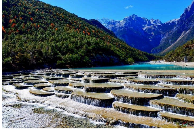
Thung lũng Lam Nguyệt

Ăn sáng tại khách sạn, sau đó đoàn khởi hành đi tới khu du lịch Núi Tuyết Ngọc Long . Đoàn tham quan: