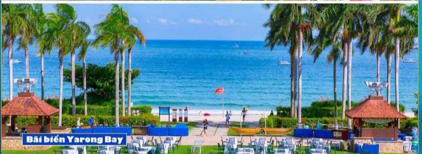
Bãi biển Yalong Bay