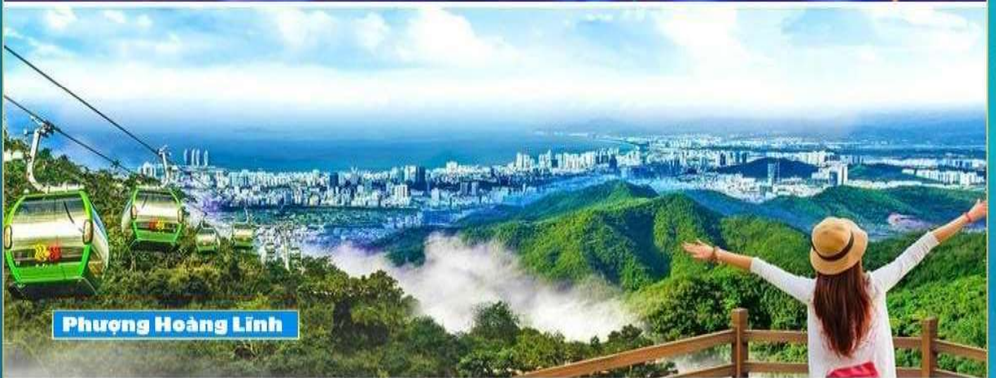
Phượng Hoàng Lĩnh