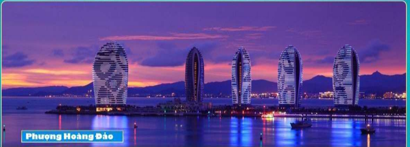
Phượng Hoàng Đảo

SELECTED ATTRACTIONS ON THE ITINERARY, ENDLESS ENJOYMENT