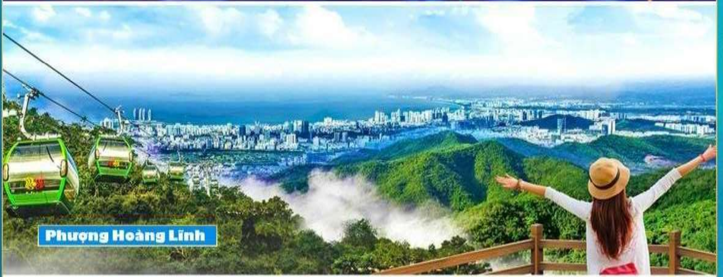
Phượng Hoàng Lĩnh