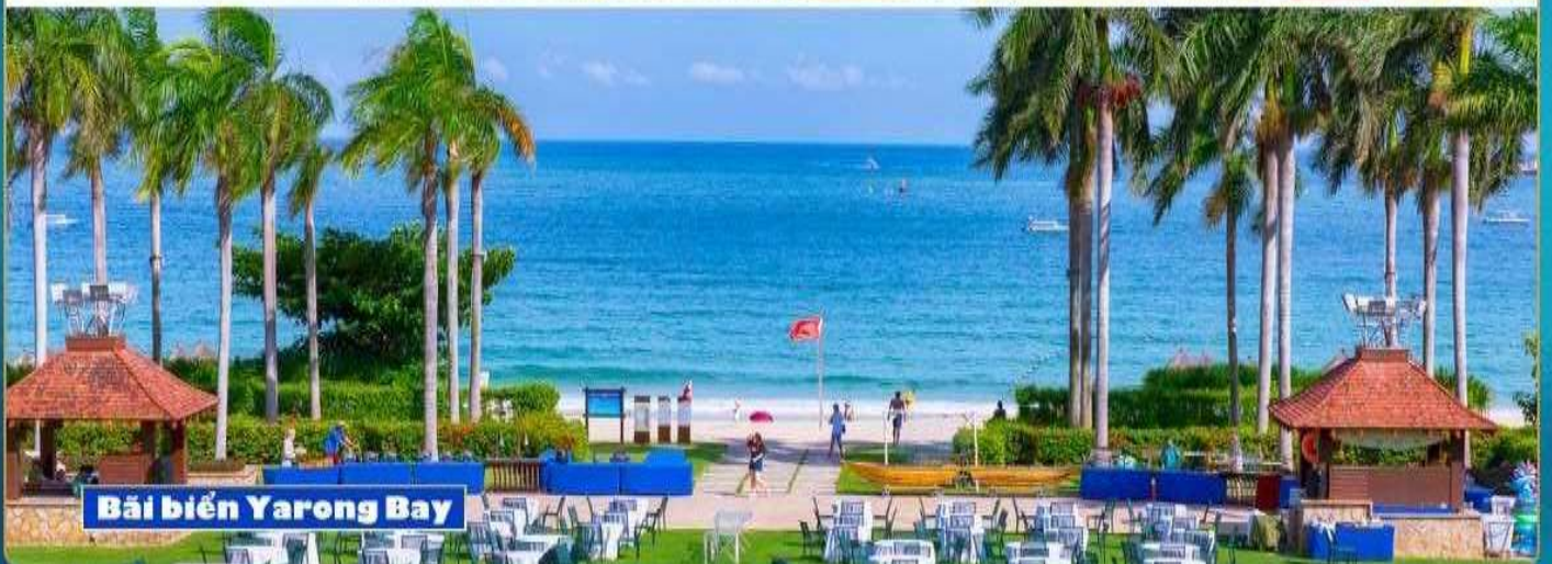
Bãi biển Yalong Bay