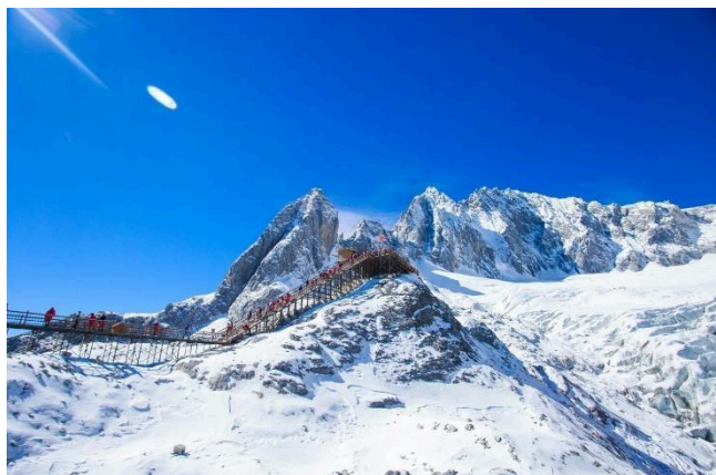
Núi tuyết Ngọc Long