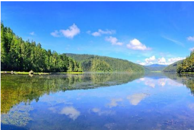
Hồ Bita – Bích Tháp