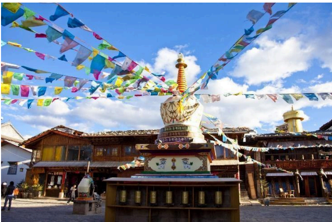
Thành cổ Dukezong