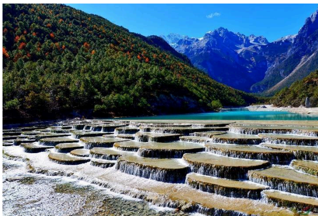
Thung lũng Lam Nguyệt

Ăn sáng tại khách sạn, sau đó đoàn khởi hành đi tới khu du lịch Núi Tuyết Ngọc Long . Đoàn tham quan: