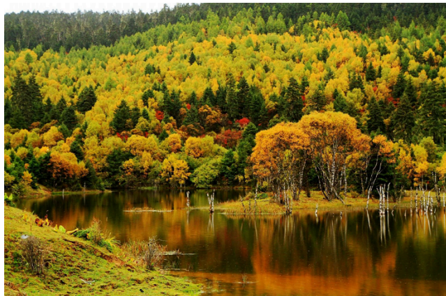
Công viên Pudacuo