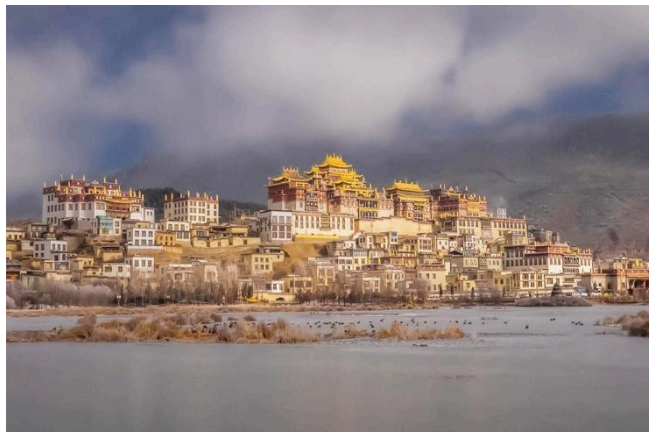
Tu Viện Songzanlin

Ăn sáng tại khách sạn, sau đó đoàn tham quan: