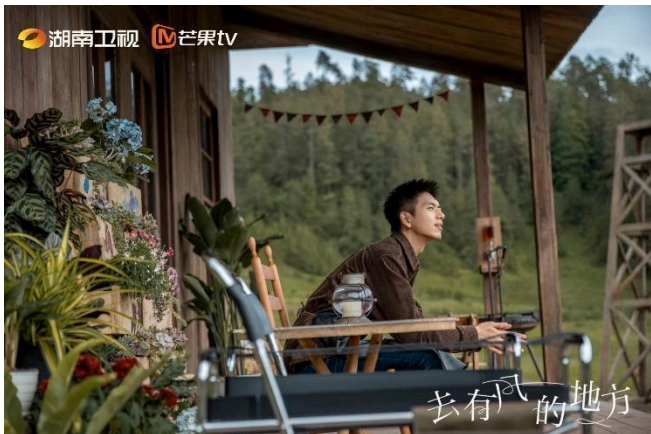
Phương Dương Ấp thôn