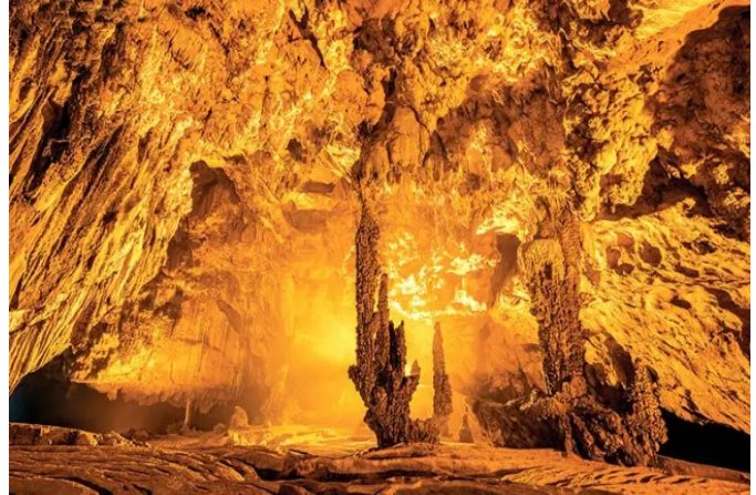
Động Ngườm Ngao