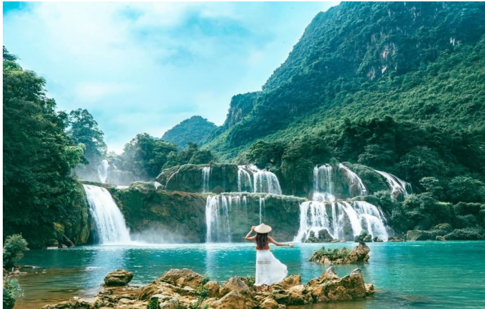
Thác Bản Giốc

19h30: Quý khách dùng bữa tối tại nhà hàng, tự do dạo chơi, khám phá TX. Cao Bằng về đêm. Nghi đêm tại khách sạn.