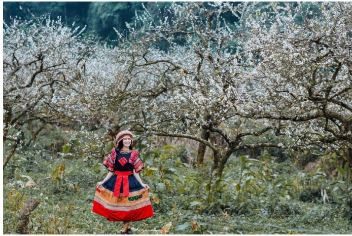
Thung lũng mật Nà Ka

Mộc Châu các mùa hoa: Tùy vào từng thời điểm, hướng dẫn viên sẽ đưa Quý khách đi chụp hình với những vườn hoa, vườn quả đặc trưng của Mộc Châu. Chắc chắn Quý khách sẽ ngỡ ngàng và ấn tượng trước những vẻ đẹp đầy sức sống và lôi cuốn ấy (Lưu ý: các vườn hoa vườn cây này như thế nào là hoàn toàn phụ thuộc vào thời tiết và kế hoạch trồng của người dân).