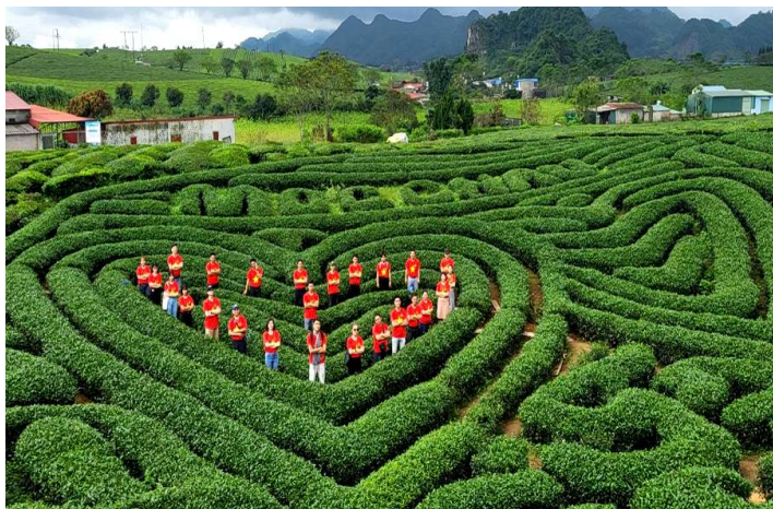
Đồi chè Trái tim