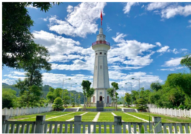
Cột cờ Lũng Pô