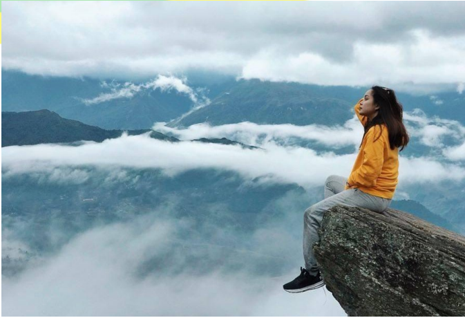
Săn mây Ngải Thầu