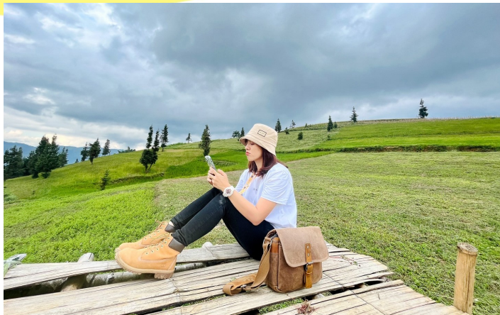
Thảo nguyên Suối Thần