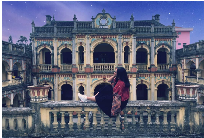
Đình Hoàng A Tưởng