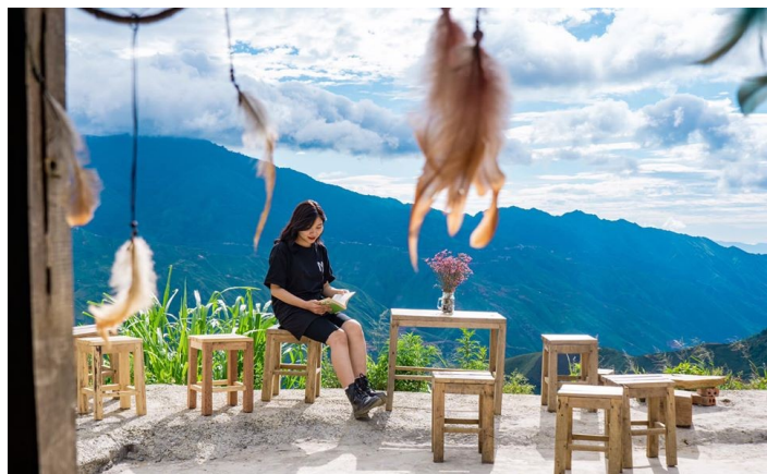
Thào Coffee Tà Xùa

Tối: Về đến Hà Nội, hướng dẫn viên chia tay Quý khách, kết thúc chương trình du lịch. Hẹn gặp lại quý khách trong những chương trình tiếp theo!