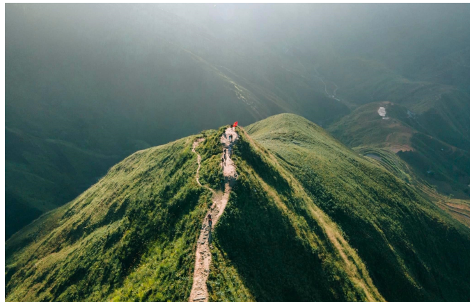
Sống lưng Khủng long