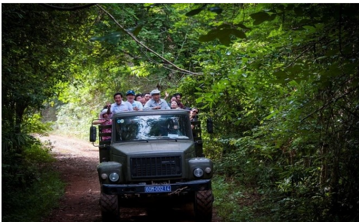
Trekking tham quan Bàu Sầu

Về tới TP.HCM, kết thúc chuyến tour du lịch Nam Cát Tiên 2 ngày 1 đêm, Du Lịch Xanh chào tạm biệt Quý khách và hẹn gặp lại Quý khách trong các tour du lịch tiếp theo.