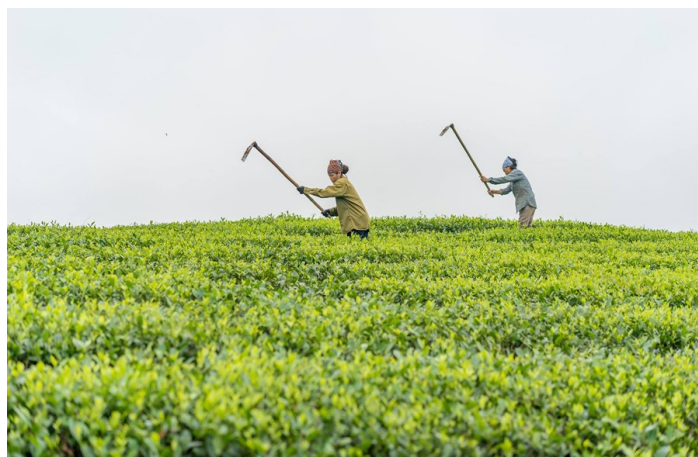
Đôi chè Thanh Sơn – Phú Thọ